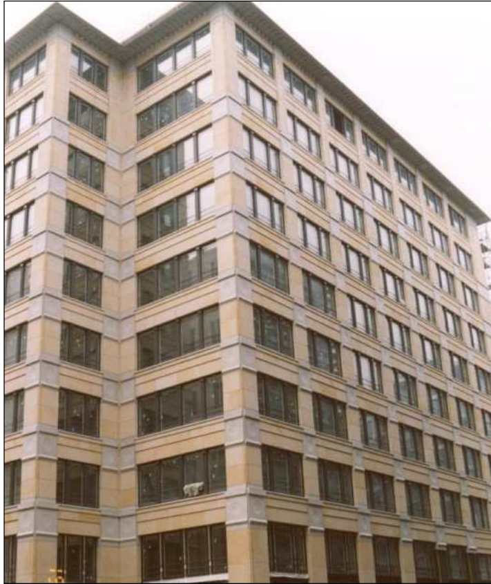
Ankerdorntechnik für Großfassadenelemente

Vorgehängte hinterlüftete Fassadenelemente dreidimensional ausgebildet, profiliert und strukturiert